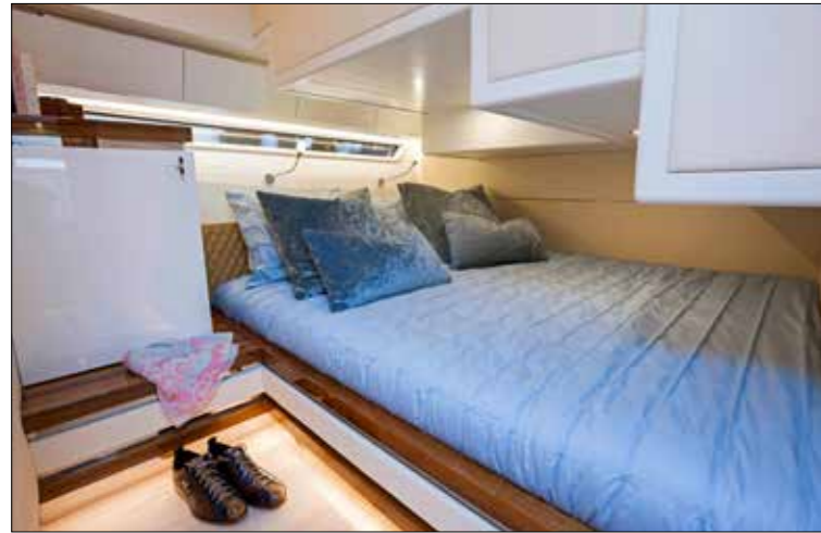
La cabine d'invités est logée sous le poste de pilotage avec un lit placé perpendiculairement à l'axe du bateau.