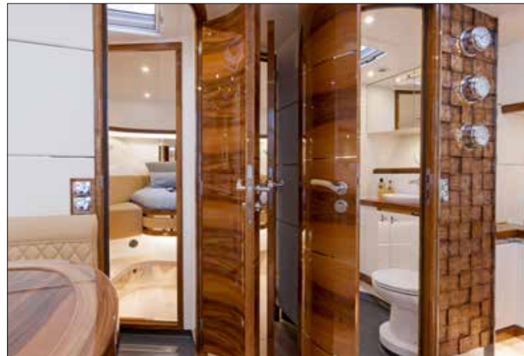
Portes en bois et cloisons en marqueterie vernissée illustrent le savoir-faire des menuisiers du chantier de Zwartsluis. Certains trouveront le résultat un peu «trop précieux».

La version coque aluminium du 1530 est aussi au catalogue avec la promesse de pointer à plus de 20 nœuds avec une motorisation de 2 x 700 ch. En dépit de son poids, le bateau se manœuvre avec facilité même s'il faut composer avec une certaine inertie en navigation. Des Rotor Swing, stab à