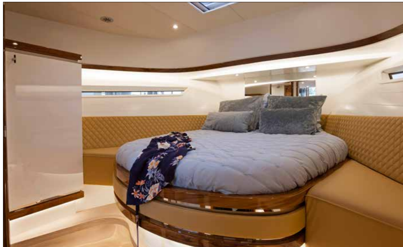
La principale chambre à coucher occupe la pointe avant. Revêtement en cuir fauve, inox miroir et bois vernis donnent le ton.