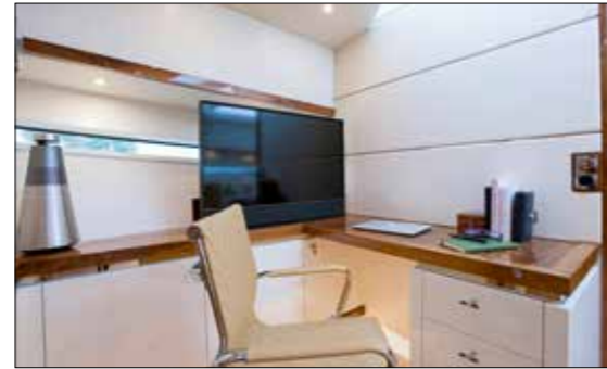
Sur le flanc tribord, le bureau d'angle est particulièrement réussi avec son mobilier sur mesure qui combine table et rangements.

► les deux salles de bain encadrant la mastercabin avant peuvent être remaniées comme on le souhaite. Côté mécanique et performances, notre trawler hollandais se montre très conservateur : avec deux Vetus Deutz de 170 ch chacun, la vitesse maxi plafonne à 11 nœuds. La conso moyenne se cale entre 25 et 40 l/h au régime de croisière (8,5/9,5 nœuds). Sur ce point, Serious ne prend pas le client en traître.