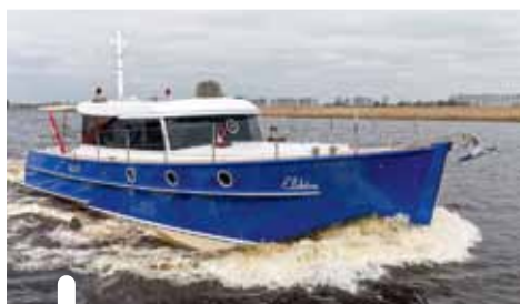
Van voren is goed te zien dat de Gently 40' een slank schip is. Onder: een flinke snor voor de kop.

De gehoute spiegel glanst als het echte mahonie. Van de rvs buizen als stootlijsten dubbelt die aan bakboord als uitlaat.