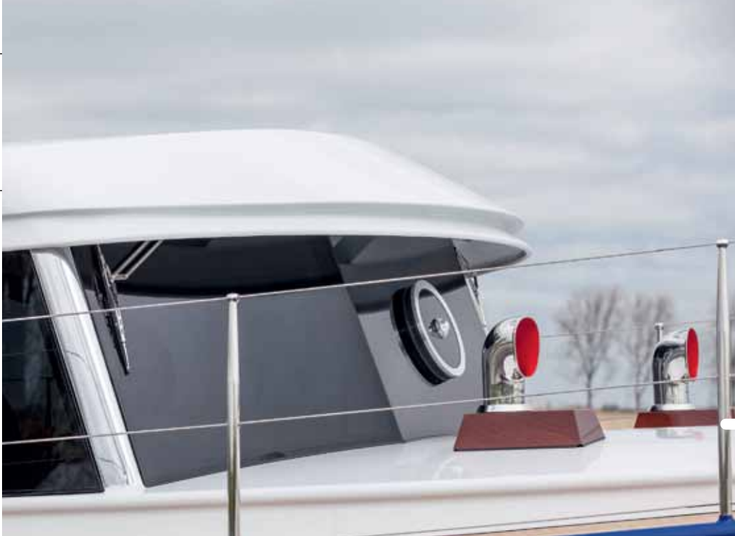
In het oog springend: de dubbele pet boven de voorruiten (zonder spijlen), de conische scepters met draadreling en de mahonie doradeboxen.